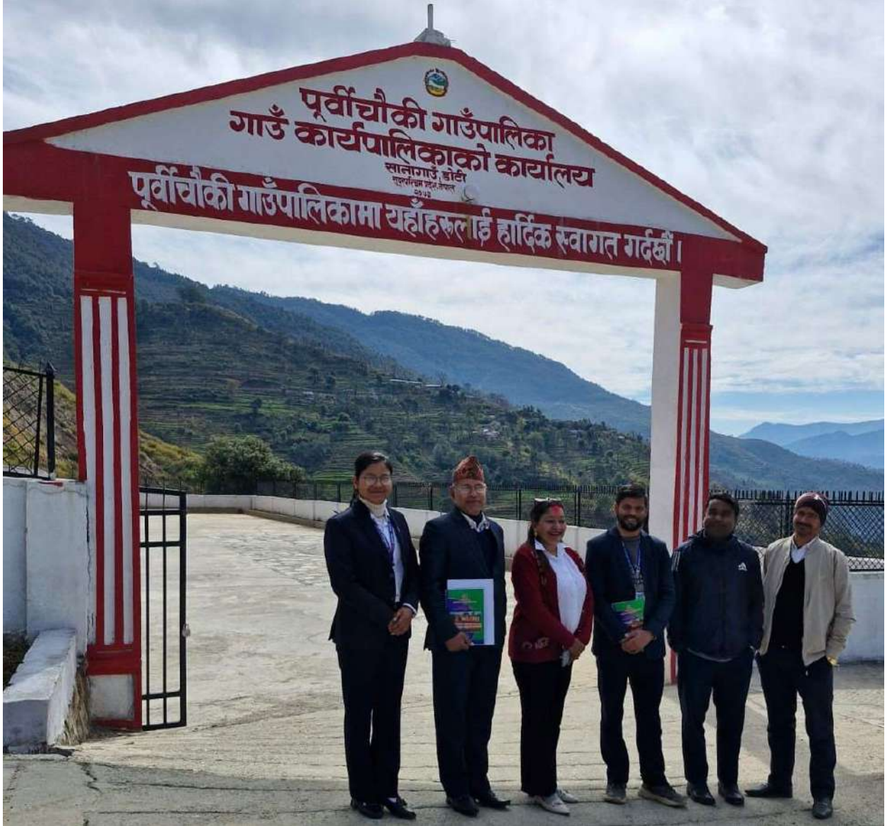
पुर्वीचौकि गाउँपालिका स्थलगत भ्रमण मा गएको समुह