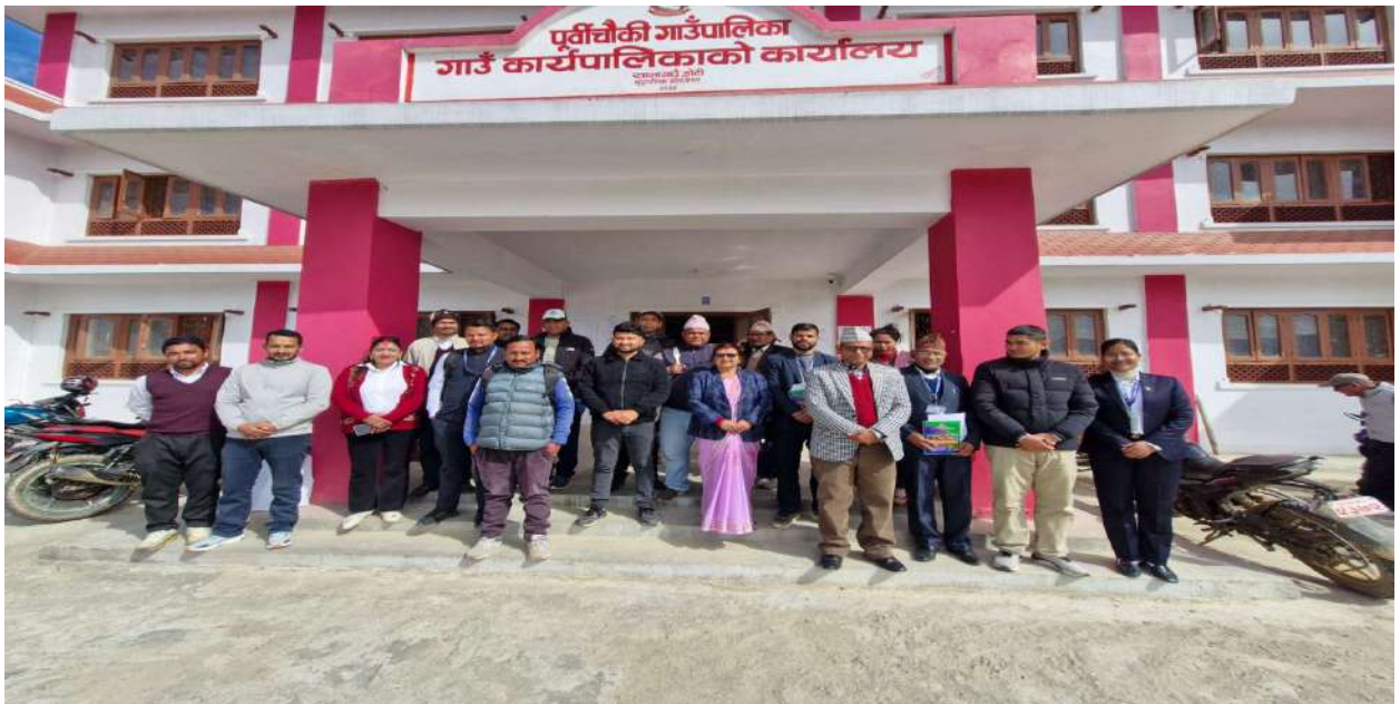
पालिका को जनप्रतिनिधिसहित को फोटो